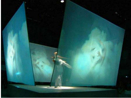
Aya - YCAM - YAMAGUCHI 2004