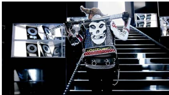
Dog - Harajuku - Japon - résidence - 2007-2011