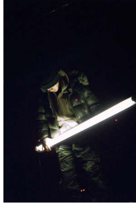
OPTRON - DVD VIDEO 2006

Happé par la richesse et la puissance visuelle de l'archipel, il prend part à de nombreuses collaborations sur la scène underground de Tokyo avec Jaqwa, Maruosa, RKO, Ifana, Optron.